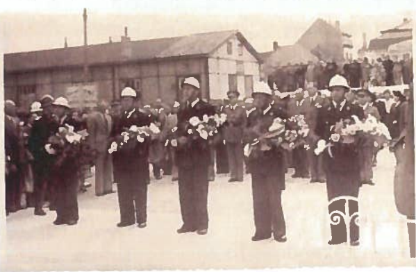
Eerbetoon aan het standbeeld met op de achtergrond oud station