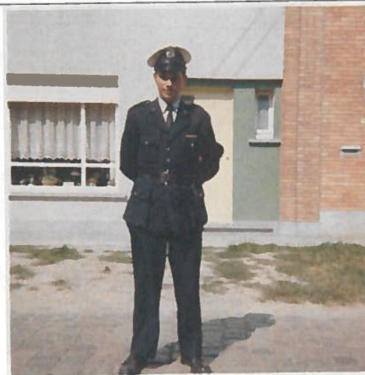
Victor Demeester 1960